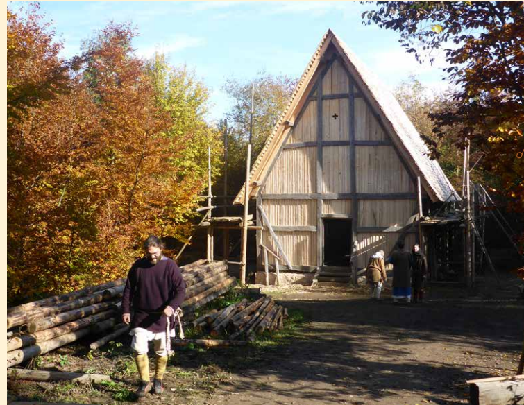
Bitte ausfüllen, abtrennen, frankieren und einsenden oder direkt abgeben.