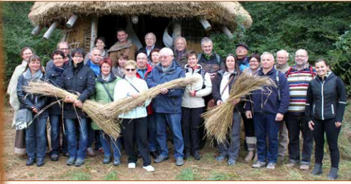
Um sich einen aktuellen Eindruck von der Klosterstadt-Baustelle verschaffen zu können, fand im letzten Oktober ein Mitgliedertag statt.